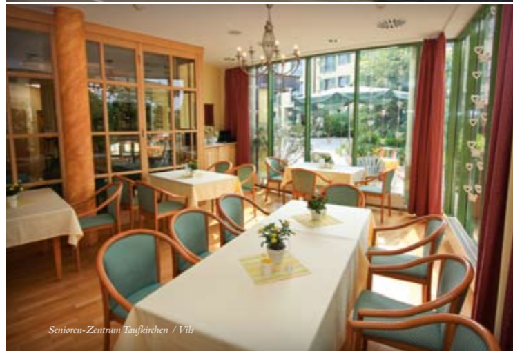
Senioren-Zentrum Taufkirchen / Vils