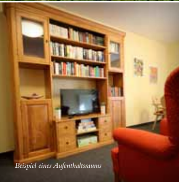
Beispiel eines Aufenthaltsraums