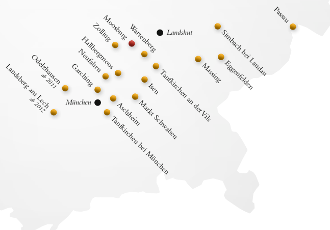
Unsere Firmenzentrale in Eggenfelden

Pichlmayr Wohn- und Pflegeheime gibt es 17-mal in Ober- und Niederbayern.