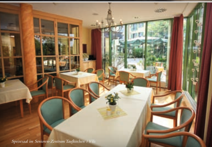
Speisesaal im Senioren-Zentrum Taufkirchen / Vils