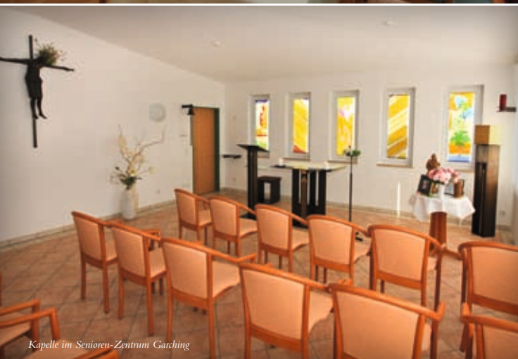
Kapelle im Senioren-Zentrum Garching